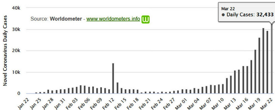
ГРАФИК ПРА ХОД ПАНДЭМІІ КАРНАВИРУСА ЗА 22 САКАВІКА. КАЛІ 21 САКАВІКА КАРНАВИРУСАМ ЗАРАЗІЛІСЯ 29 439 ЧАЛАВЕК, ТО 22 САКАВІКА 32 433