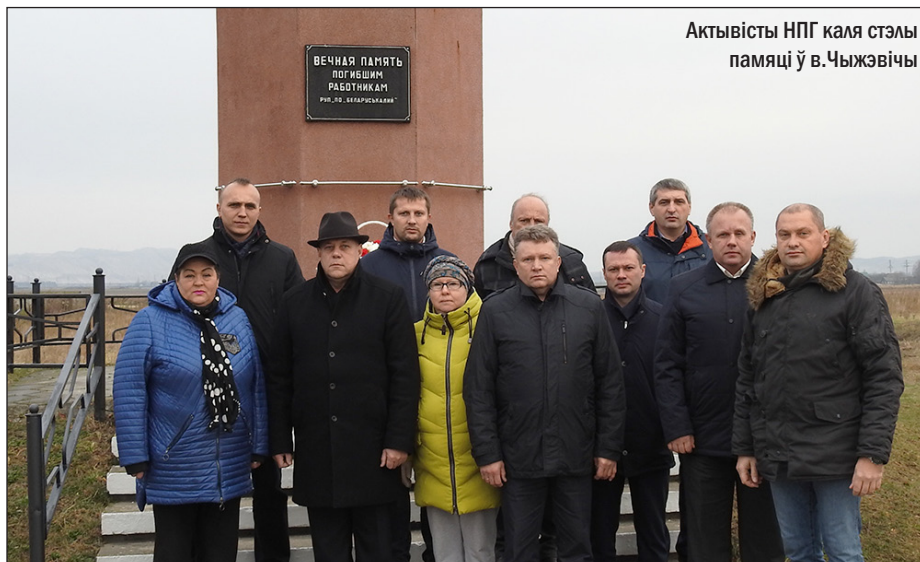
Актывісты НПГ каля стэлы памяці ў в.Чыжэвічы

Па старадаўняй традыцыі, напачатку лістапада, беларусы адзначаюць Дзяды – дзень прысвечаны памяці памерлых продкаў. Пярвічныя арганізацыі Беларускага Незалежнага прафсаюза ўзгадалі сваіх памерлых актывістаў і работнікаў, якія загінулі на вытворчасці.