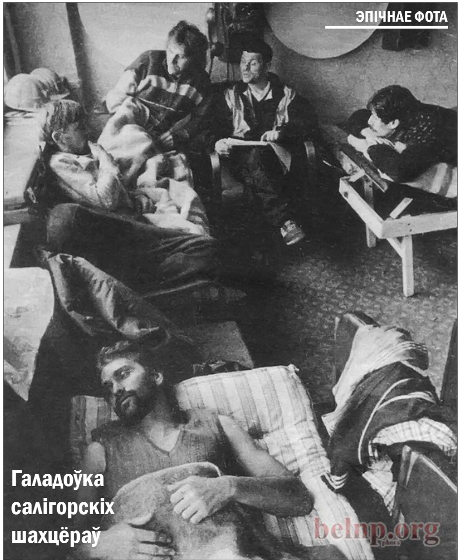
Галадоўка салігорскіх шахцераў

Страйк, галадоўка, марш на Мінск і мітынг на плошчы Незалежнасці, далі рэзультаты. Патрабаванні Салігорскіх шахцераў былі выкананы. Заробкі і адпачынак былі павышаны, а кіраўніцтва “Беларуськалій” звольнена.