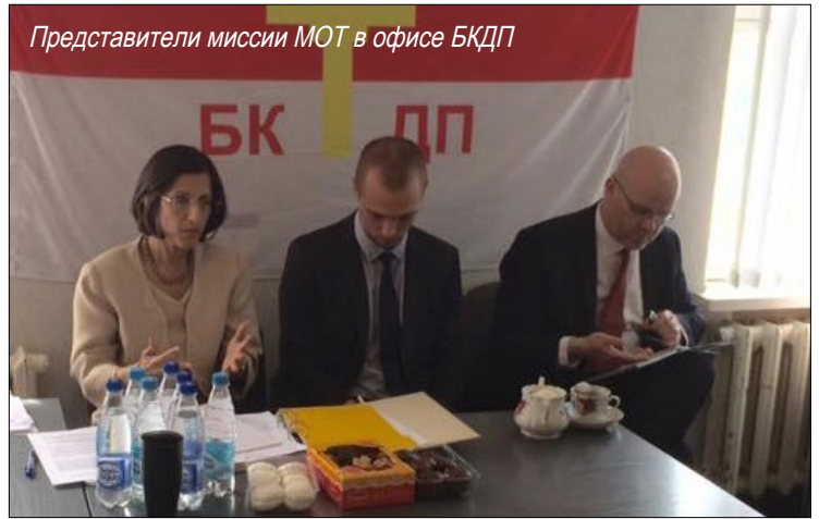
Представители миссии МОТ в офисе БКДП

Членами Совета был рассмотрен вопрос проведения массовой акции во Всемирный день борьбы за достойный труд, который проходит во всем мире 7 октября. По мнению некоторых профсоюзных лидеров, этим мероприятием необходимо начинать заниматься уже сейчас, подготавливать актив и членов