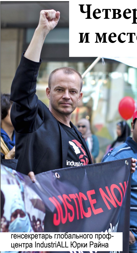
генсекретарь глобального проф-центра IndustriALL Юрки Райна