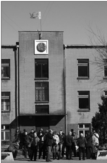
пачатак на стр. 1

арганізацыі працы гэта будзе таксама прадметам разгляду. І, канечне, ня будзе стаяць пытаньня аб вяртаньні прэфэрэнцыяў. А паколькі абвастрэўся і на іншых прадпрыемствах ціск на незалежныя прафсаюзы, то магчыма, што будзе спэцпараграф».